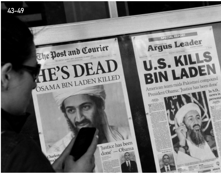
Abbildung 43-49: Am 02. und 03. Mai 2011 waren die Zeitungen voll von den Meldungen zur erfolgreichen Tötung Osama Bin Ladens. Nicht nur im fernen Westen wie Deutschland oder England wurde über die Tötung Osama Bin Ladens berichtet, sondern auch in den Vereinigten Staaten von Amerika sowie in anderen fernen Ländern, in denen „Bin Laden“ der Innenbegriff für Terror war. Spürbar ging eine Hoffnungswelle durch das Land, zu wissen, dass einer der Top-Terroristen (in den USA: Most Wanted People) nicht mehr unter den Lebenden weilt. Während es für die einen wieder mehr Hoffnung gab, feierten wiederum andere seine Tötung und bejubelten das damals daran beteiligte US Seal-Team, dessen Mitglieder streng geheim und bis heute nicht bekannt sind. Auch wenn immer wieder dementiert wird, dass es eine „gezielte Eliminierung“ gewesen sei, so sind sich Experten doch recht sicher, dass es genau das gewesen ist, wie 2021 nun auch vom CIA zugestanden worden ist. Nicht wegen der Blutrünstigkeit oder extremen Rachegeleuten, sondern eher aus dem Grund, weitere Probleme, die mit einer Verhaftung von Bin Laden einhergegangen wären, bereits im Vorfeld zu vermeiden. Kurz nach dem Tod Bin Ladens, wie dieser auch vom Al-Qaida Netzwerk legitimiert wurde, änderte sich einiges in Afghanistan und Pakistan. Al-Qaida löste sich auf und bildete mit den Taliban eine neue Allianz, die sich später „Islamischer Staat (IS)“ nannte. Mit dem ersten richtigen Aufkommen des IS oder auch ISIS im Jahr 2012 und 2013, wurde auch bekannt, dass sich die ehemaligen Kämpfer Bin Ladens in dem neuen Terrornetzwerk befanden und dort weiter kämpften ...