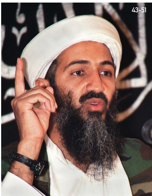
Abbildung 43-51: Osama Bin Laden als Anführer von Al-Qaida während einer seiner Hasspredigten gegen den Westen. Wenn man eine Person zweifelsfrei identifizieren will, dann benötigt es in jedem Falle einer Fotografie, die die entsprechende Person zu Lebzeiten zeigt und hierzu auch eine solche, die ganz klar als verifiziert gilt. Bei der Person in Abb. 43-51 handelt es sich verifiziert um Bin Laden (vergl. hierzu Abb. 43-49).

Zeigt eines der Todesbilder von Bin Laden wirklich Bin Laden oder eher nicht? Es kursieren seit einigen Jahren Bilder im Internet, die angeblich den toten Osama Bin Laden zeigen sollen. Zu allem Überfluss sind es dabei inzwischen auch noch zwei unterschiedliche, die irgendwie doch die Selben sind. Ich selbst weiß als neutraler Betrachter, dass man diese Fotografien unter anderem beim arabischen Satellitennachrichtensender „Al-Arabiya“ (s. Abb. 43-50) gezeigt hat, woraufhin diese dann im World Wide Web weiter vervielfältigt und geteilt worden sind. Ob es sich dabei um offizielle Fotografien handelt, kann an dieser Stelle nicht gesagt werden, wobei hier eher davon auszugehen ist, dass sie es nicht sind und stattdessen eher um Fotomontagen handelt, die jemand aus bestimmten Gründen angefertigt hat. Nicht tragisch, denn das soll und kann hier nicht bewertet werden – bewerten und analysieren lässt sich dies hier auf anatomisch-forensischer Basis, ob es sich hierbei wirklich um Osama Bin Laden handelt oder eben nicht. Betrachten Sie hierzu die folgenden Abbildungen einmal genauer, besonders 43-52 bis 43-54