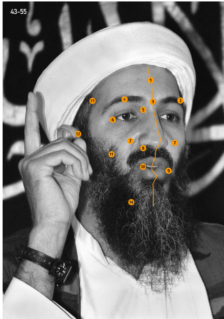
Abbildung 43-55: Die anatomisch-forensische Bestimmung des Gesichts von Bin Laden nach gezielten Analysemarkern. Gezielt der Frage nach, ob es sich bei einigen Fotografien um Osama Bin Laden handelte oder nicht, führte ich eine ausgedehnte forensische Untersuchung durch, um mir zunächst einmal charakteristische Merkmale seines Gesichts herauszuarbeiten. Hierfür nutzte ich ausschließlich verifizierte Fotografien, die eindeutig Bin Laden zeigten. Herausgearbeitet habe ich in dieser anthropologisch geführten Analyse 14 Merkmale, nach denen ich in den anderen Fotografien gesucht hatte und welche im wesentlichen den Bestimmungsmerkmalen von Dr. Helmer entsprachen.

Das Ergebnis dieser Untersuchungen war, dass keines der im Umlauf befindlichen Fotografien Bin Laden bei seinem Ableben zeigten. Während Bin Laden ein eher leptosomer & kaum trainierter Mann mittleren Alters war, zeigten die anderen Fotografien eher einen Mann des pyknischen Typs I in einem Alter von etwa Mitte bis Ende 30.