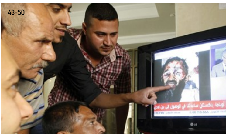
Abbildung 43-50: Die Iraker sahen den arabischen Satellitennachrichtensender Al-Arabiya, welcher ein Bild zeigte, das anschließend im Internet zirkulierte & angeblich die Leiche des Al-Qaida-Drahtziehers Osama Bin Laden zeigen sollte.