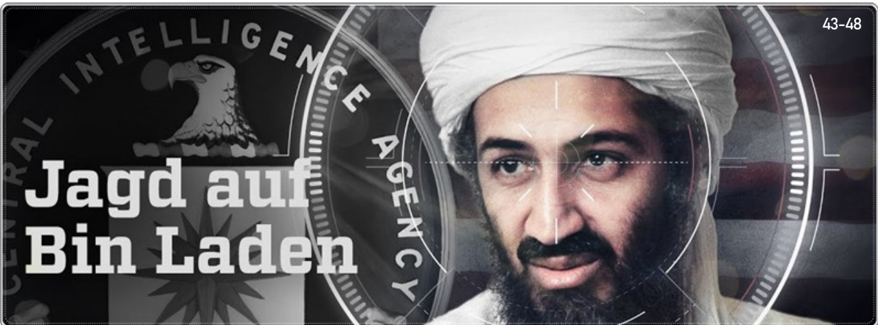
Abbildung 43-48: Titelbild der ZDF-Neo Dokumentation „Codename Geronimo – Wie die CIA Osama Bin Laden tötete“ zeigt einen Mann, dessen Fotos in jener Pose und dem selben Ausdruck, zu Hauf aufzufinden sind. Hauptsächlich auch viele Fotografien aus seinen jüngeren Jahren und den anführerischen Anfängen des Al-Qaida Terrornetzwerkes. Doch wir alle wissen, dass sich Menschen mit dem natürlichen Alterungsprozess verändern. Die einen weniger – die anderen mehr. Nun stellte sich die Frage, wie Osama Bin Laden wohl im Jahr 2011 aussehen würde? Sicher war nur eines, nicht mehr so, wie einst 2001.

So musste man hier natürlich auch forensisch weiterdenken, nicht nur im Sinne von etwaigen DNA-Proben und der Gleichen, denn diese waren zum Zeitpunkt der Seal-Zugreifung natürlich nicht möglich. Dennoch aber musste eine Sicherheit her, wie Bin Laden wohl aussehen würde bzw. müsste, denn der Auftrag (wie man heute weiß) war recht klar, Bin Laden zu Töten – und nicht zu verhaften. Der Kontext zu diesem recht klaren Befehl ist schnell erläutert: Ein lebendiger Terrorist wie Osama Bin Laden hätte mehr als genug Mittel gehabt, sich aus der Haft befreien zu lassen – hätte also eine weitere andauernde Weltgefahr bedeutet, wenn Anschläge verübt worden wären, um den Topterroristen aus der Haft frei zu erpressen. Eine gezielte Tötung erschien hier sinnvoller – auch mit der Hoffnung dahingehend, das Terrornetzwerk mit seinem Tode zu zerstören. Zweiteres gelang, wie sich mit dem Laufe der Jahre gezeigt hatte, nicht zuletzt durch dem Aufkommen von Islamischen Staate (IS / ISIS), der zwar auf den Wurzeln des Al-Qaida Netzwerkes aufbaute, in sich aber eine eigenständige Terrororganisationsstruktur aufwies.